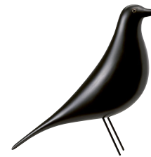
VITRA Heames House Bird uccellino in legno