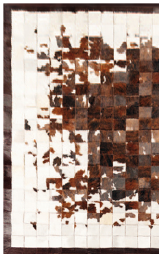
TOSCONOVA tappeto - mod. Jasper