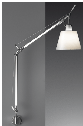
ARTEMIDE lampada - mod. Tolomeo