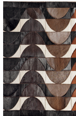
TOSCONOVA tappeto - mod. Swell